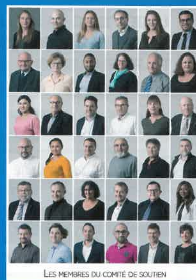
LES MEMBRES DU COMITÉ DE SOUTIEN

→ Notre équipe regroupe des femmes et des hommes engagés pour Saint-Cyr-l'École dans ses commerces, ses entreprises, et ses associations. Reconnus pour les compétences qu'ils ont développées dans leurs domaines respectifs, ses membres